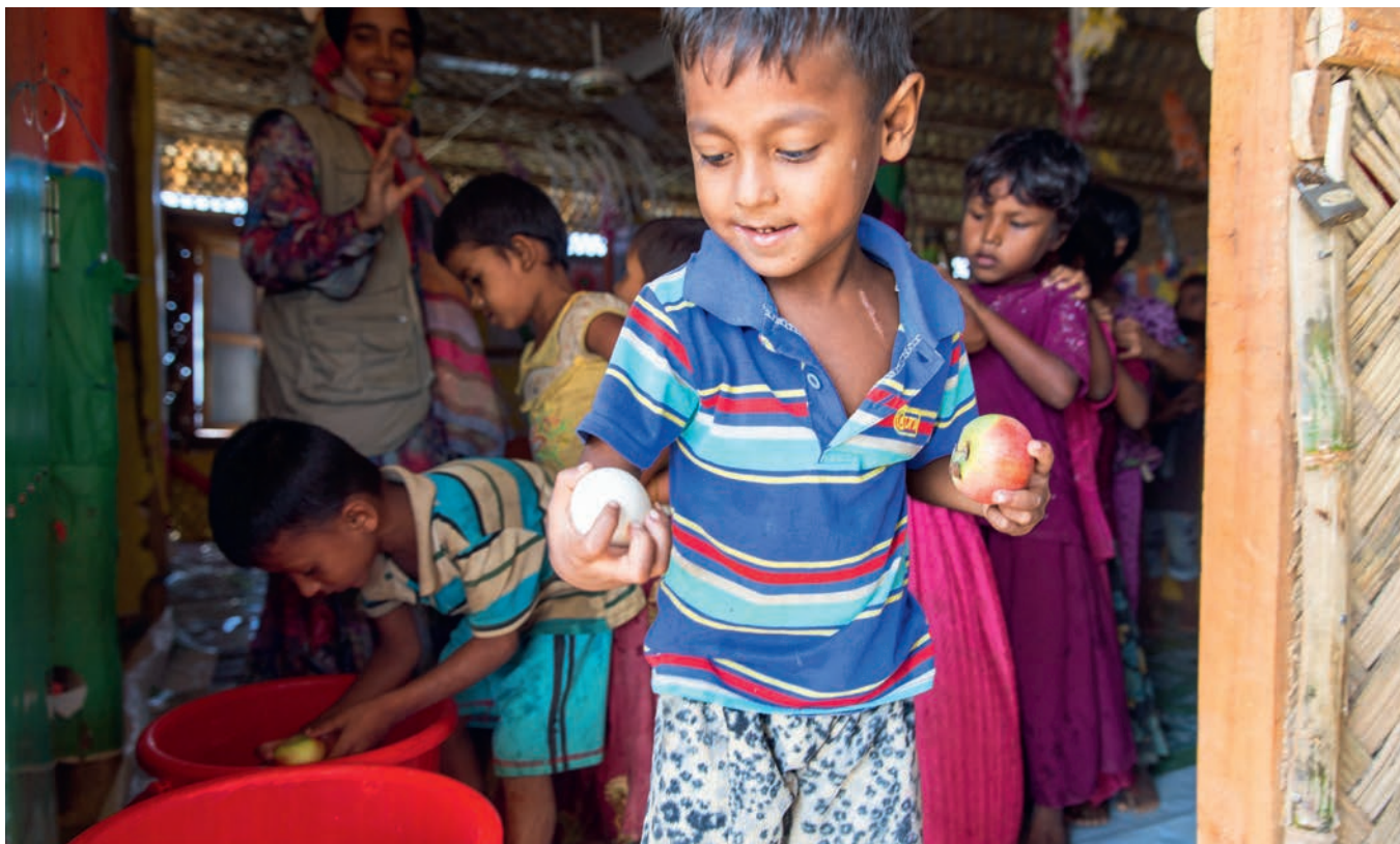
Ein Apfel und ein Ei für den jungen Mann. Der Vorrat im Kinderzelt des Flüchtlingslagers Kutupalong reicht auch noch für die weiteren Kinder, die anstehen.