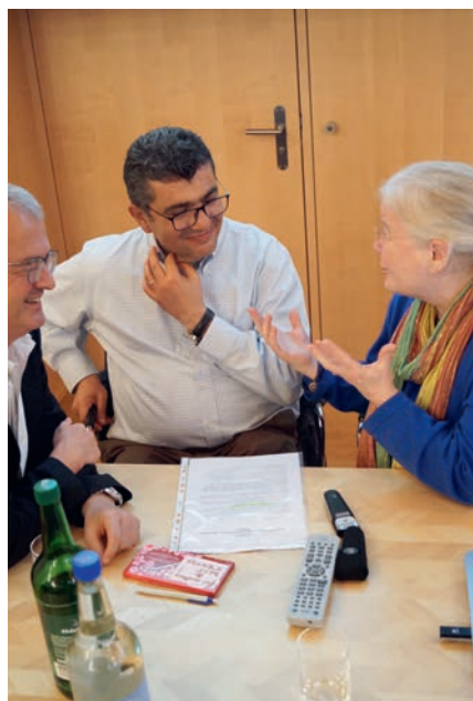
LINKS: Kloster Mar Musa, «Taizé des Orients», geprägt vom verschollenen Paolo dall'Oglio SJ, hat Wurzeln bis ins 6. Jahrhundert – und lebt langsam wieder auf.